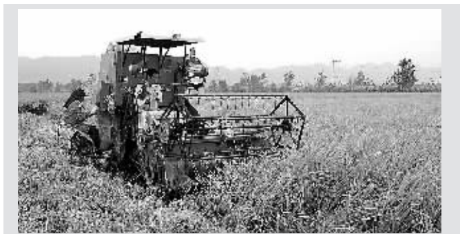
目前，江西省晚稻已大面积开镰收割，中稻已基本收割完毕。据了解，今年江西省中、晚稻播种面积、单产、总产呈现“三增”的良好态势，秋粮丰收已成定局。图为瑞昌市赛湖农场田间进行晚稻收割作业。